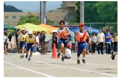
代表リレー「赤白リレー2019」