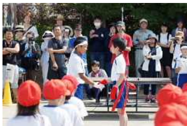
応援団長の握手「がんばろう！」