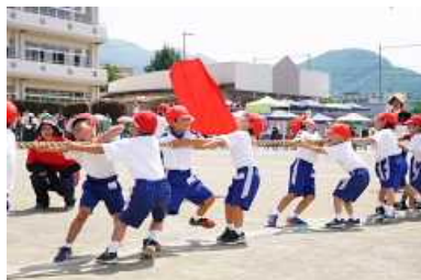
低学年つなひき「力をあわせて」