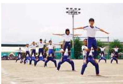
5・6年表現「K・U・M・I・T・A・T・E 2019~Rock on Friends~」