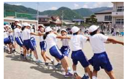
高学年つなひき「心をひとつに」