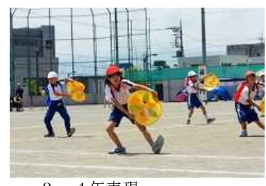
3・4年表現 「shake it off HANAGASA」