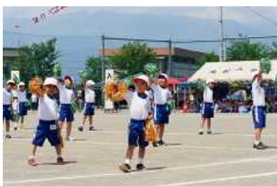
1・2年表現「スペースヒーローズ」